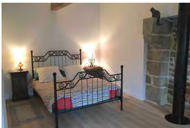
Chambre pour 2 personnes gîte à l'étage 50 € par nuit